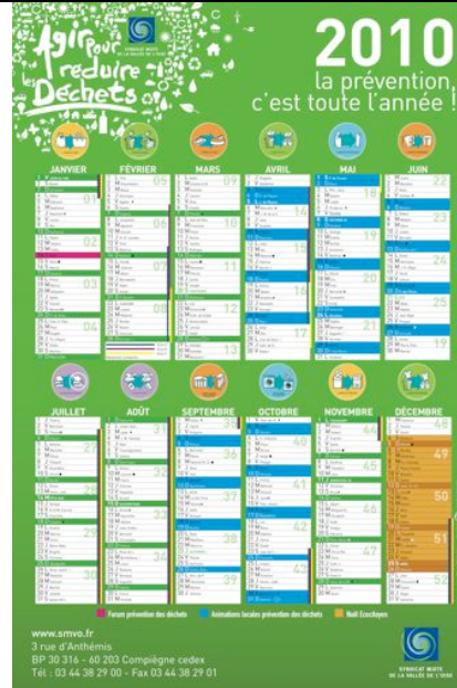
Invitation « Forum Prévention » sous forme de Calendrier « prévention »